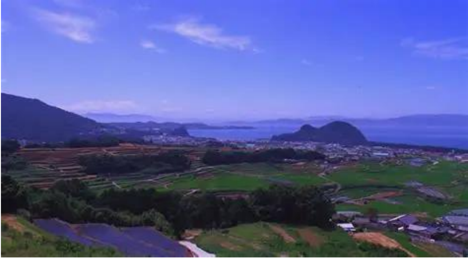
La ciudad de Kazusa actual en la península de Shimabara en la provincia de Nagasaki