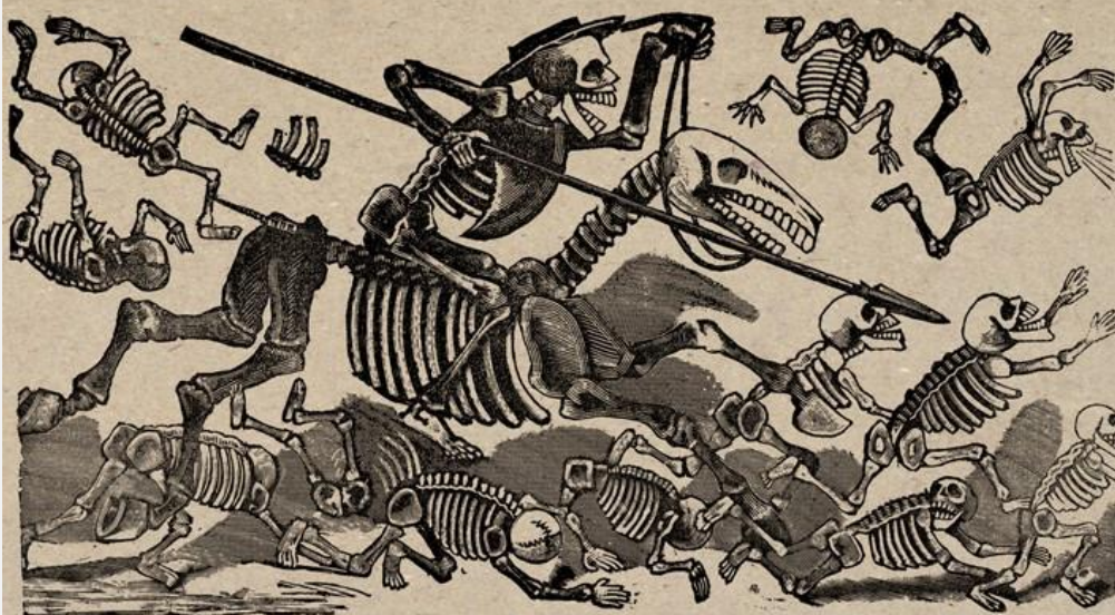
Calavera: "Don Quijote"

o por qué los anarquistas aman a Cervantes