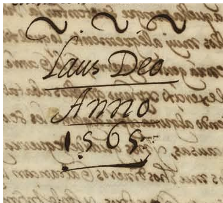
La fecha que aparece al final del texto principal, fol. 321v.: 1565.