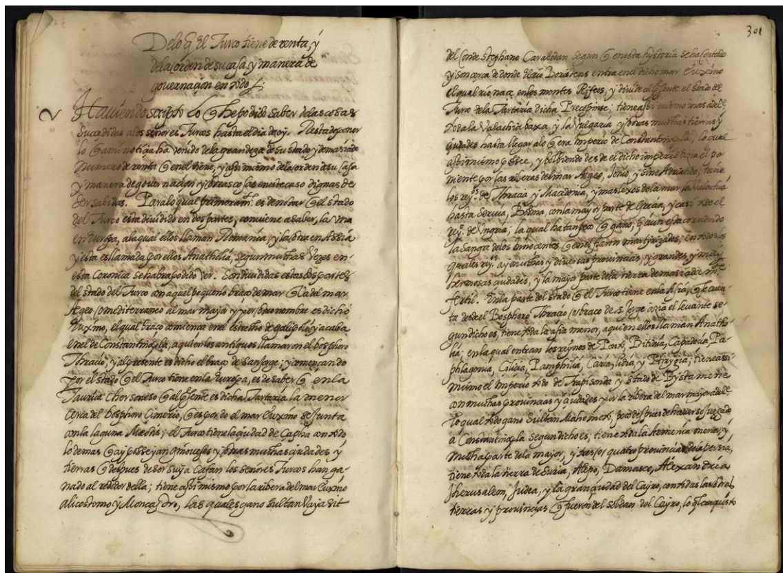
Primera página, ff. 300v-301r.

Los dos textos, correspondientes al ejemplar original de la Crónica de los Turcos de Madrid y a la copia de Budapest, a pesar de titularse de distinta manera son idénticos en su contenido salvo en la fórmula de agradecimiento final: “Laus Deo” en el manuscrito original y “Finis huius Cronica ad laudem Dei omnipotentis Maria virginis eius matris quos in omnibus duces invoco”, en el manuscrito de Budapest.