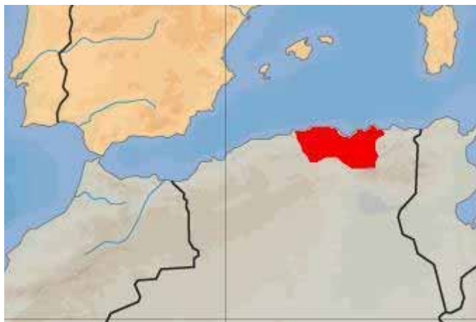
Región de Cabilia, emplazamiento de Cuco.

Cuco era una región de la que se habla en las fuentes del siglo XVI. Aunque era denominada reino (y en efecto su gobernador era intitulado como rey), no sería más que una serie de asentamientos musulmanes en la zona montañosa de Cabilia, entre Argelia y Túnez.