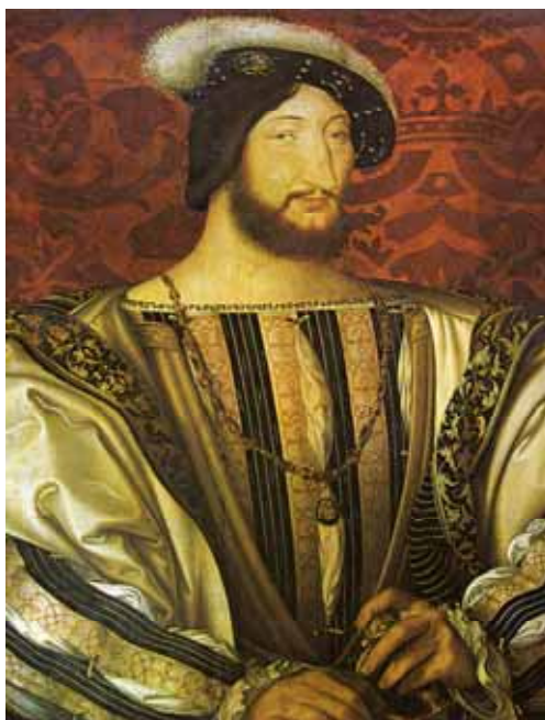
Francisco I de Francia.

La correspondencia que Carlos V mantiene con príncipes musulmanes (como es en este caso) pone de manifiesto que la supuesta razón que debería mover a un emperador cristiano, la defensa de su religión por encima del infiel, no era lo que realmente propiciaba los actos de la monarquía hispánica. No sólo es que tuviera buenas relaciones con estos príncipes, si no que como ya hemos visto intentó comprar al mismísimo almirante en jefe otomano. El interés político-económico era el motor de las relaciones internacionales en el mediterráneo del siglo XVI, aunque es lógico que se vendiera como cruzada contra el infiel, pues es un motivo legitimador como pocos.