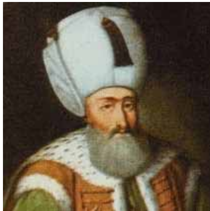
Solimán el Magnífico

Carlos V siempre estuvo al corriente del asunto, incluso fue advertido por el propio Papa en 1533.