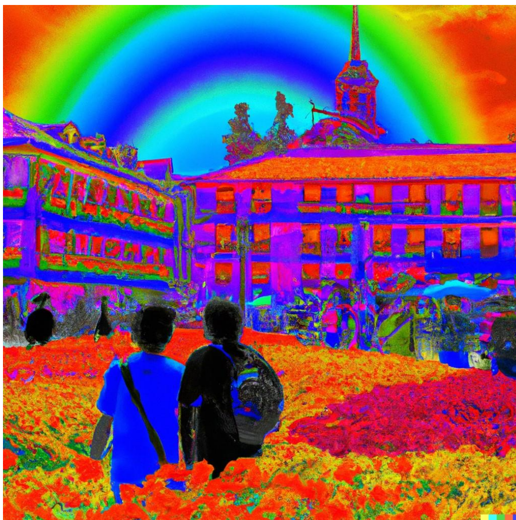
Foto cuadro generado por IA