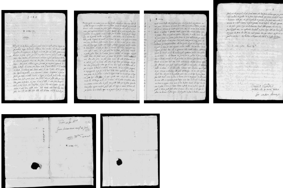
[marca de agua: caminante con pica, inscrito en círculo, letras MR]

1560, 14 de julio, Trapani. Juan Andrea Doria a su majestad. “Respondidas a 13 de septiembre”.