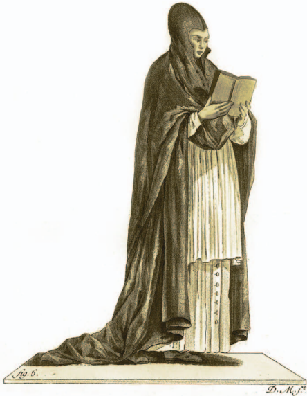
Religioso Trinitario, grabado, siglo XVIII.