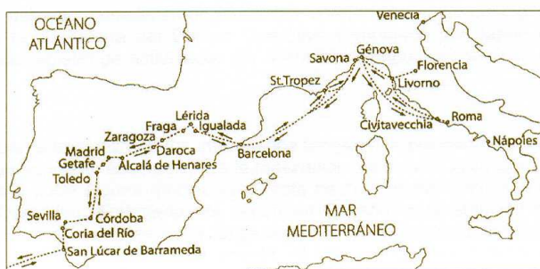
Los itinerarios realizados por la Embajada Keicho y sus itinerarios entre España e Italia (inferior)