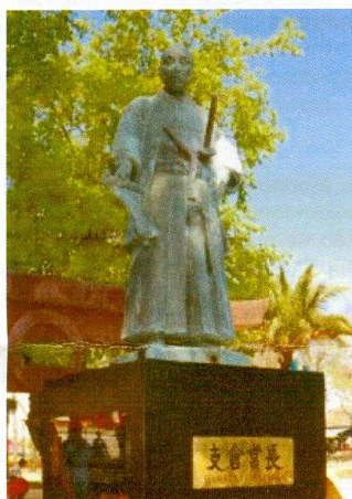
Estatua de Hasekura en Coria del Río